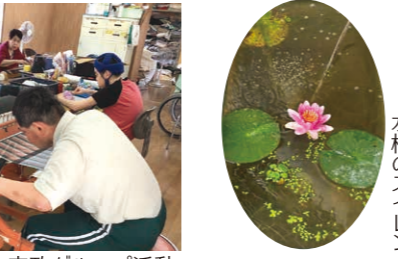
家政グループ活動