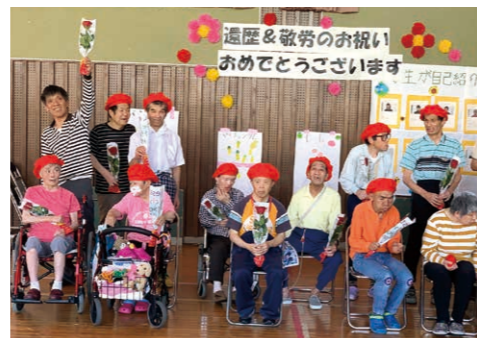
還暦・敬老のお祝い