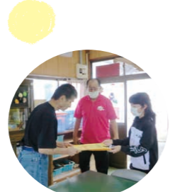
大下条小の小学生さんが遊びに来てくれました