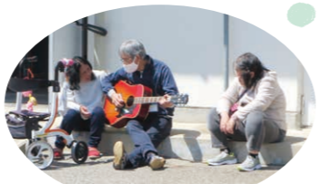
新理事長ミニライブ