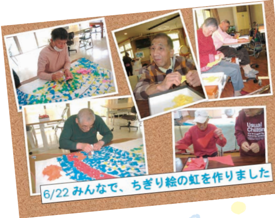
6/22 みんなで、ちぎり絵の虹を作りました