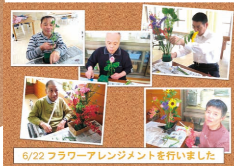
6/22 フラワーアレンジメントを行いました